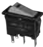
DS-413 (with LED)